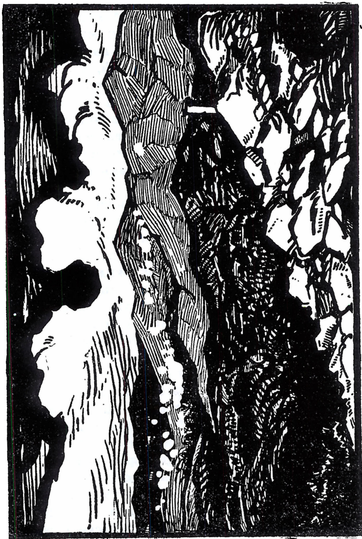
Предната Дойранска позиция подъ огънь