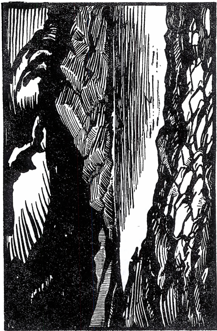
Доѳранското езеро съ Дубъ и Кала-геле