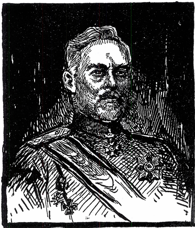
Генералъ-лейтенантъ Владимиръ Вазовъ, командиръ на 9-а Плъвенска дивизия